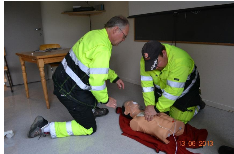
Folkehelse – Teknisk øver på førstehjelp