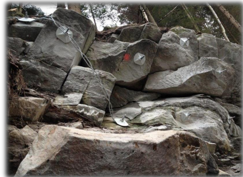
Bilete 8: Rassikring.

Kompetanse og planverk må tilpassast nye krav, overordna risiko- og sårbarheitsanalysar (ROS-analysar) må gjennomførast, og samfunnstryggleik må få ein brei plass i areal- og verksemdsplanar. Dei siste åra har vi opplevd større flaum enn tidlegare, noko som stiller større krav til konsekvensutgreiingar og at ein unngår nybygging i fareområde. Det betyr at i åra som kjem vil tilpassing og oppdatering av planverk, kompetansehevingstiltak, øvingar og samarbeid med andre instansar, og investering i sikringstiltak ha eit særskilt fokus.