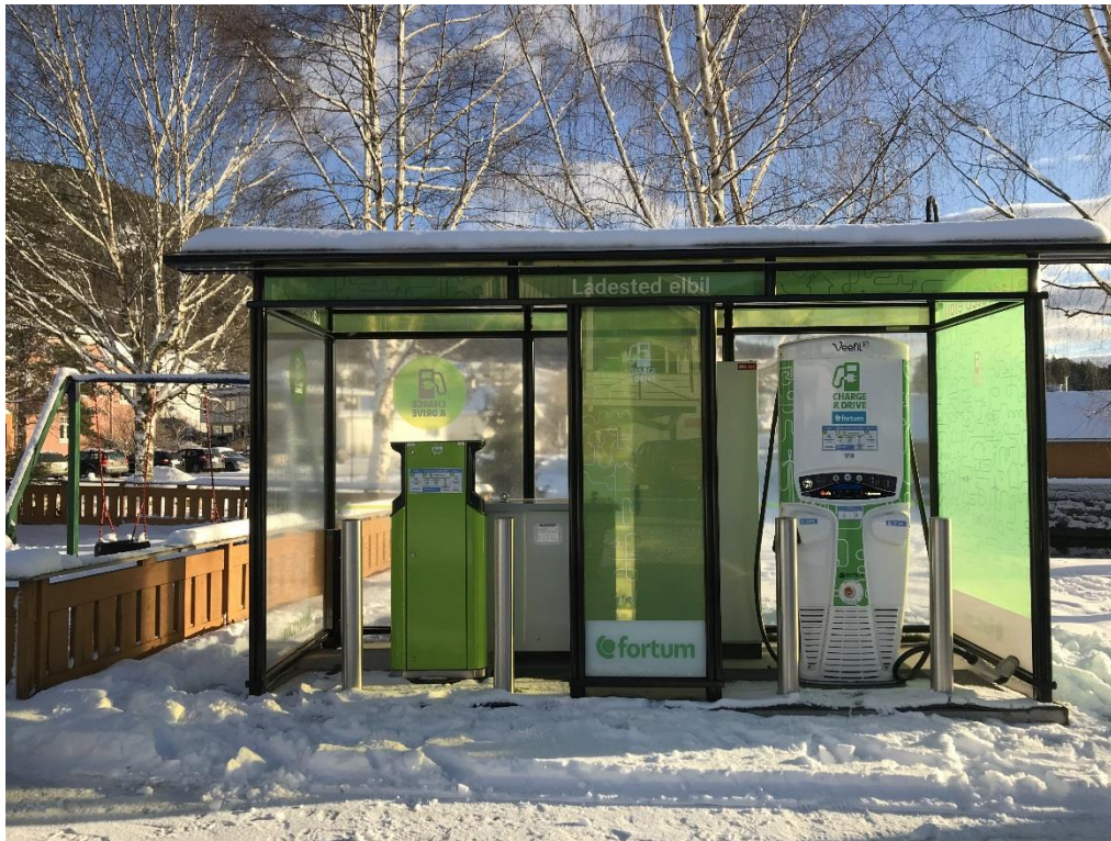
Bilete 11: Vegval. Framtidas bensinstasjon

Flytting av E134 vil gje endra køyremønster gjennom kommunen, men det er framleis usikkert når dette skjer.