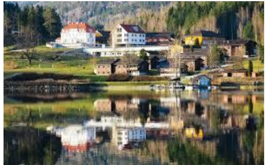
Bilete 2:Kvitsund

I tillegg til Kvitsund er Vest-Telemark vidaregåande skule viktig for Kviteseid.