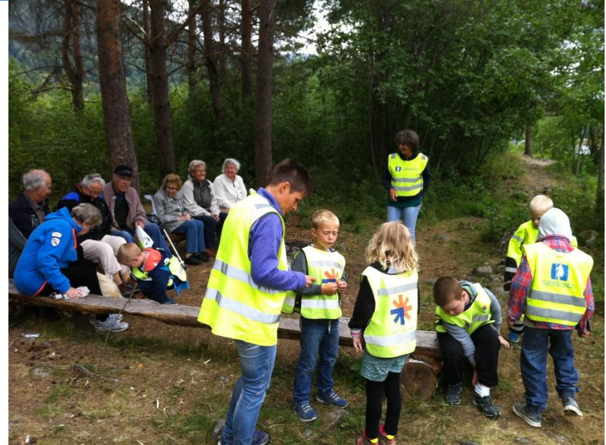
Aktivitetsdag i Ågapet

Samfunnsdelen som heilskap skildrar fleire mål og tiltak som dreier seg om folkehelse. Arbeidet vidare blir å utvikle ein eigen handlingsplan for folkehelsearbeidet i Kviteseid, noko som krev ein grundigare gjennomgang og oversikt over helsetilstanden på kommunenivå. Like viktig som å identifisere negative påverknadsfaktorar og utfordringar, er å sjå på dei ressursane som påverkar helse i eit lokalsamfunn. I Kviteseid er natur og friområde lett tilgjengeleg. Vi har eit rikt kultur- og idrettstilbod samt ei aktiv kyrkje, som gjev sosiale møteplassar. Alle desse ressursane er med på å gje eit godt grunnlag for folkehelsa i Kviteseid.