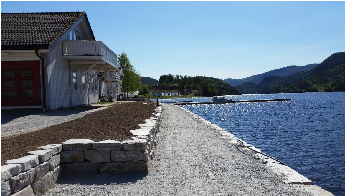
ny gjestebrygge 2016

Kommunen må legge til rette for bygging i sentrumsområdet.