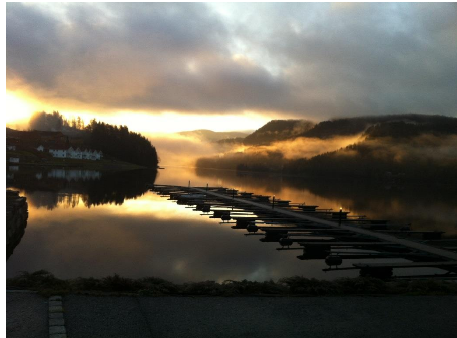
sentrumsnære leiligheter

Utbygging av nye areal både til bustader og hytter gjev eit auka press på tilrettelegging av småbåthamner og det er liten/ingen kapasitet i dei eksisterande båthamnene i kommunen. Det må opnast for utviding av eksisterande hamner og etablering av nye.