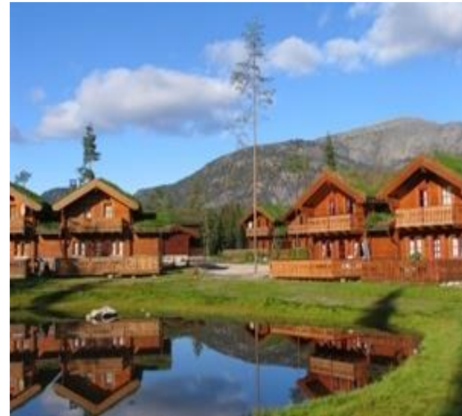
Bilete 10: Vrådal.

Utbygging av nye areal både til bustader og hytter gjev eit auka press på tilrettelegging av småbåthamner og det er liten/ingen kapasitet i dei eksisterande båthamnene i kommunen. Då båtplass og tilgang til vatn er viktig for mange av dei som ynskjer fritidsbustad i Kviteseid må det opnast for utviding av eksisterande småbåthamner og etablering av nye.