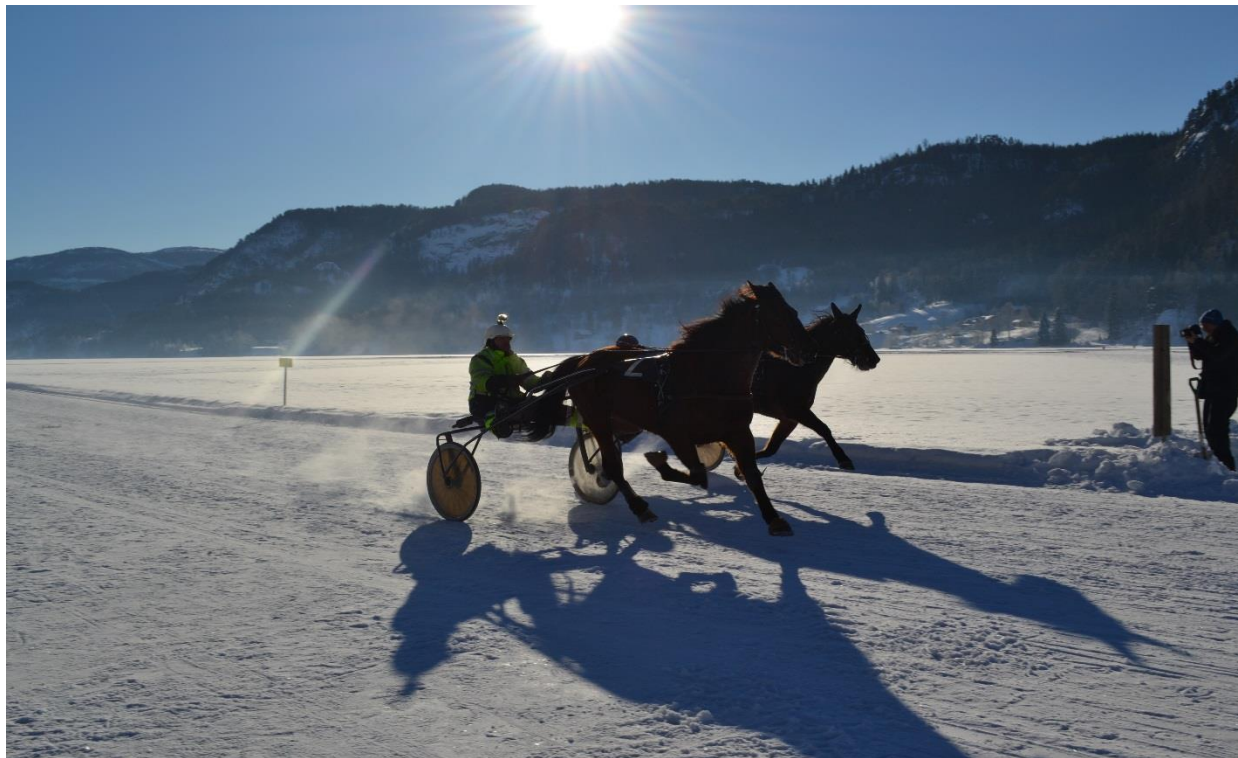
Tråvløp på Isen under Kviteseidmarknaden