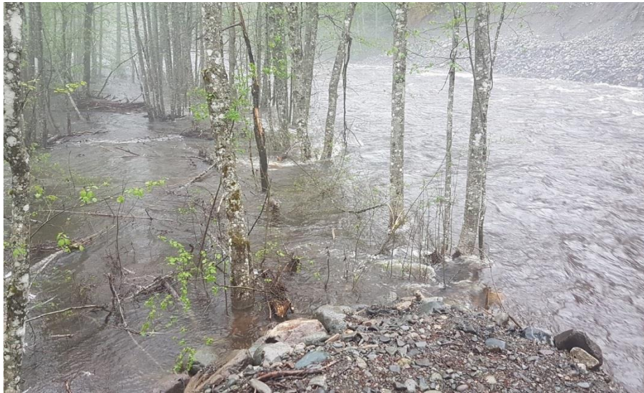
Bilete 7: Flaum Dalaåi

Kommunen må vere rusta til å møte kriser av forskjellig storleik og konsekvens; frå ras og ureining, skogbrann, svikt i straumforsyning til pandemi og større ulykker. Kommunen må også ta høgde for å takle situasjonar som har oppstått som følge av ekstremver.