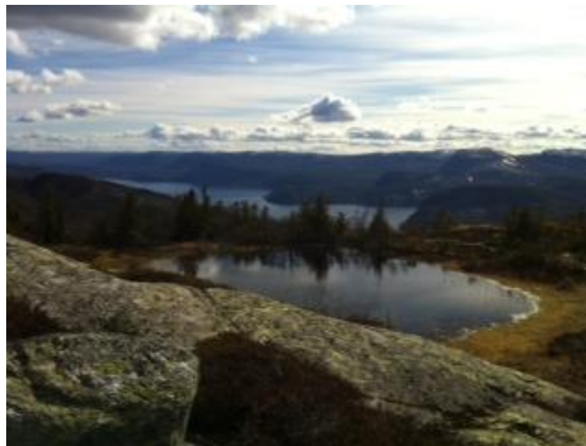
Utsikt frå Venlifjell

Det biologiske mangfaldet i kommunen har vore registrert, men framleis er det store deler av kommunen som endå ikkje er kartlagt. Naturmangfaldet må takast vare på og ein må gjennom all planlegging ta omsyn til det og unngå nedbygging av viktige lokalitetar og artar. Det er to naturreservat i kommunen, som må forvaltast på ein god måte